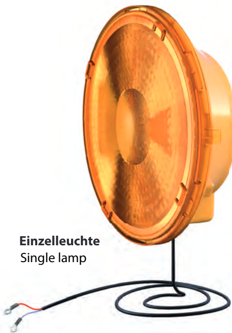
Einzelleuchte Single lamp