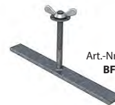
Art.-Nr. | Item N° BF.10040