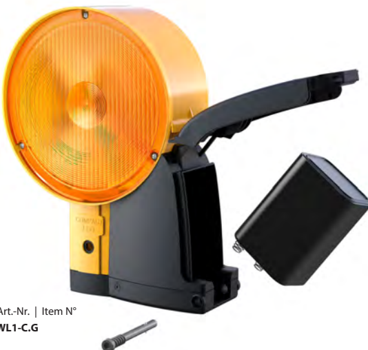
Art.-Nr. | Item N° WL1-C.G