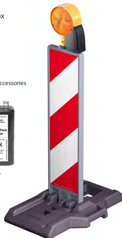
6V- Blockbatterie / 4R25 6V- Lantern battery / 4R25