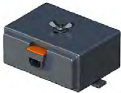
Externe Batterie External battery