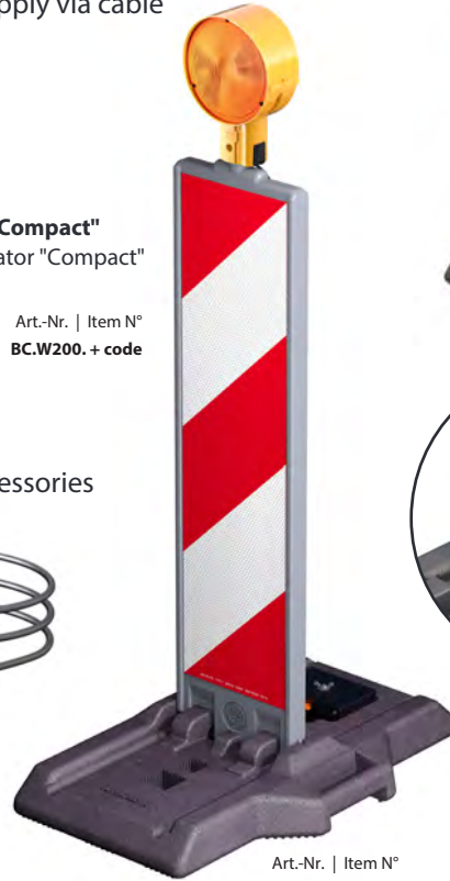
Art.-Nr. | Item N° BF.10250