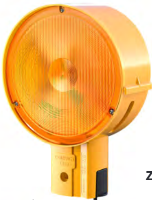
Art.-Nr. | Item N° WL1-S.G