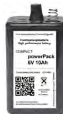
Art.-Nr. | Item N° BAT-AL.6V10