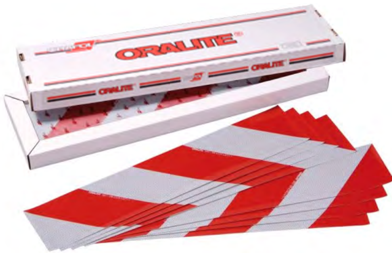
Anwendungspaket = je 4 Streifen links- und 4 rechtsweisend á 141 x 705mm Application kit = 4 strips left-pointing, 4 strips right-pointing, each 141 x 705mm