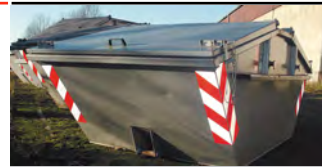
RA2 Aufbau C (HIP)