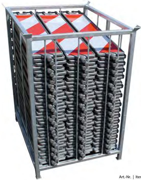
Art.-Nr. | Item N° BC.99100